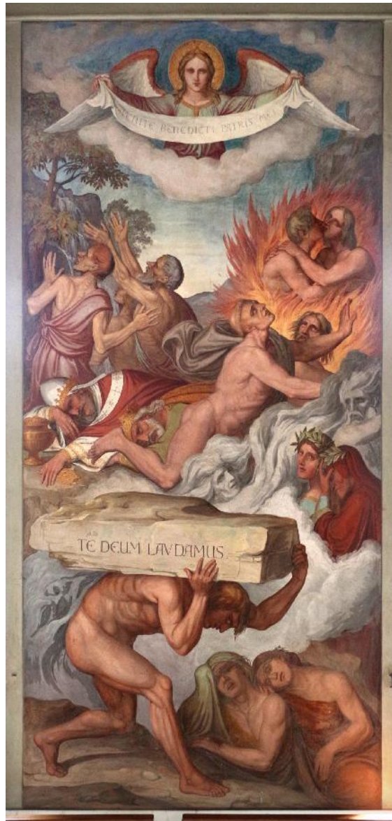
Abb. 1: Joseph Anton Koch, Die Büßer auf Dantes Läuterungsberg – Fresko 1825-28; Rom, Casino Massimo Lancellotti (am rechten Rand unten Dante und Vergil in der Rauchwolke); Bildquelle: https://upload.wikimedia.org/wikipedia/commons/4/4c/Joseph_Anton_Koch%2C_purgatorio%2C_1825-28%2C_10.jpg