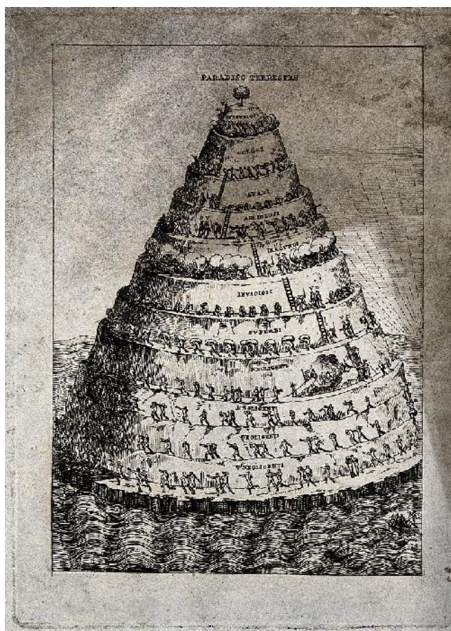
Abb. 4: Dantes Läuterungsberg; Bildquelle: https://de.wikipedia.org/wiki/Datei:A_cone-shaped_mountain_rises_out_of_the_sea_crowned_by_a_tr_Wellcome_V0047947.jpg 43

Interessant ist der Hinweis, dass der Engel “unaufgefordert” (“ sanza prego ”, V. 56) zum Steigen einlädt. Das erinnert an Marias Verhalten, wie es im 2. Höllen -Gesang beschrieben wurde: Von sich aus, ohne darum gebeten zu werden, ergriff sie die Initiative zu Dantes Rettung, als sie sah, dass dieser von den 3 wilden Tieren, Symbolen für seine Hauptlaster, bedroht wurde ( Inf. II 94-99). Sie wandte sich an die Hl. Lucia, und die wiederum begab sich zu Beatrice, welche dann zu Vergil in den Limbus hinabstieg, um diesen zu Dante zu schicken. Maria verkörpert hier die zukommende Gnade ( gratia praeveniens, gratia gratis data ), wie sich im letzten Gesang der Göttlichen Komödie im Gebet des Hl. Bernhard von Clairvaux bestätigen wird ( Par. XXXIII 16-18). Genauso wie Maria handelt der Engel hier auf dem Läuterungsberg. 44 Er wartet nicht, bis Dante ihn nach dem Aufstieg fragt, sondern zeigt von sich aus die Stiege.