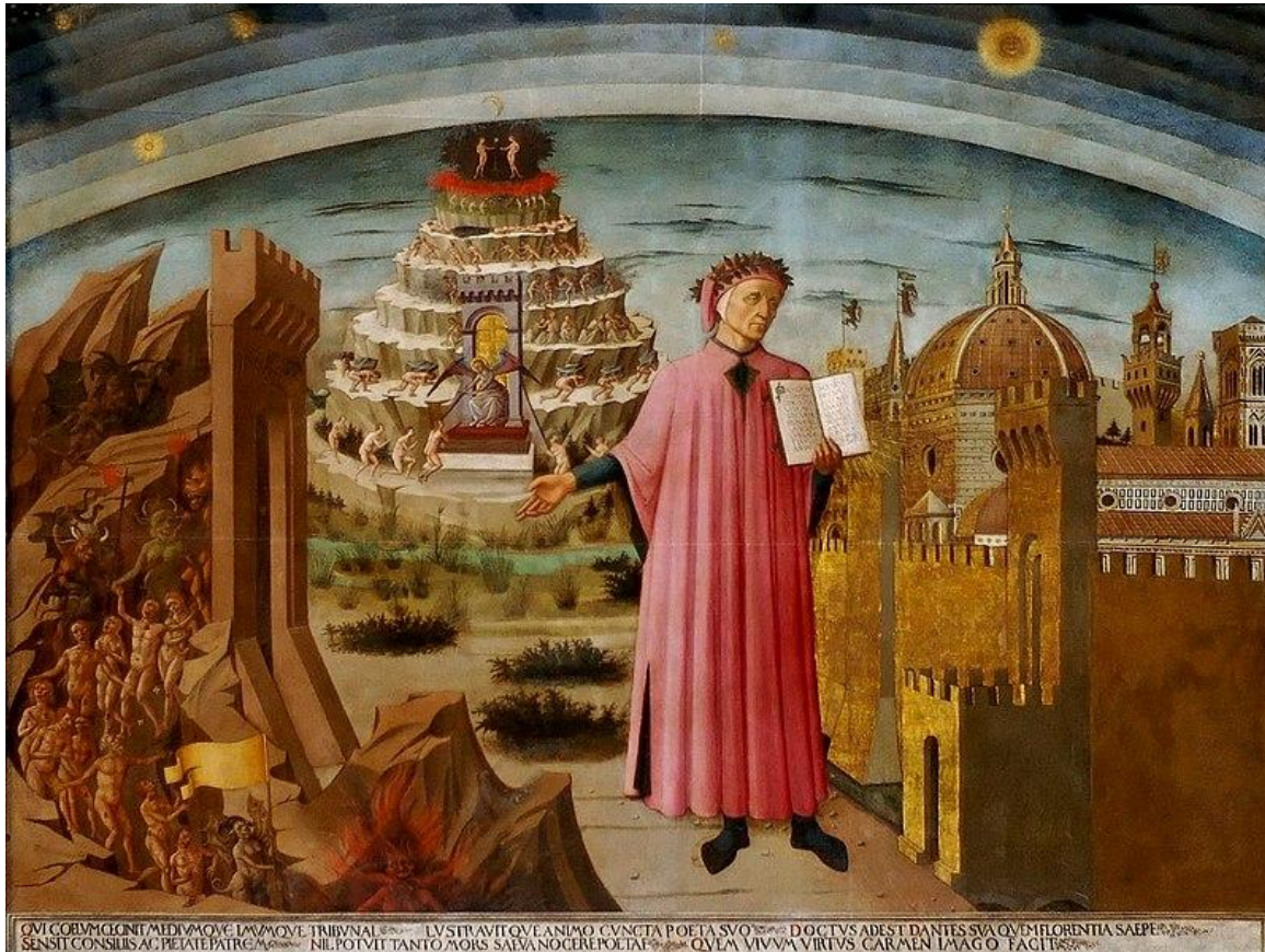
Abb. 2: Domenico di Michelino, Dante und die 3 Jenseitsreiche (1465) – Rauchwolke auf der 3. Stufe des Läuterungsbergs; Bildquelle:

Als Dante aus der Wolke heraustritt, steht die Sonne schon sehr niedrig. Es ist also kurz vor Sonnenuntergang. 11 Damit gibt er dem Leser zu verstehen, dass seit seiner Ankunft auf der Stufe der Zornigen in der Nachmittagssonne ( Purg. XV 1ff) einige Stunden vergangen sind.